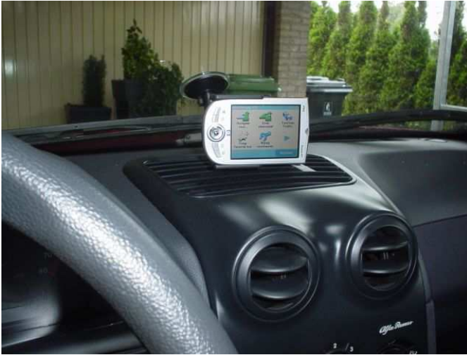
De oude situatie, lijkt trouwens ook niet zo'n zuignap op je raam