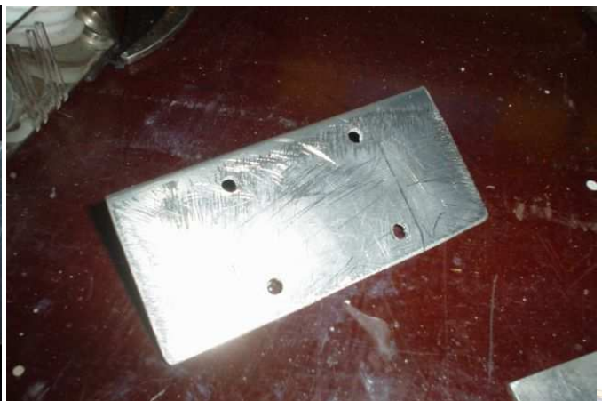
Gaatjes boren en vijlen