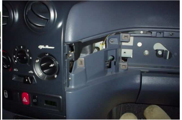
Even de ruimte opmeten