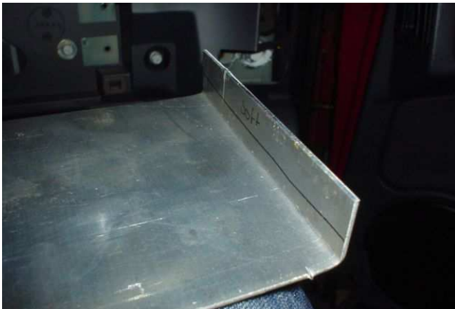
En het aluminium even buigen