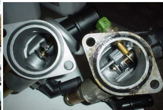
nieuw en oud naast elkaar