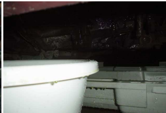
bak onder je thermostaat zetten en aftappen