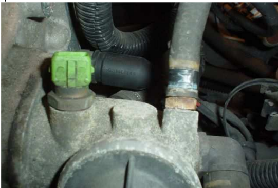
Temperatuursensor eruit draaien (let op kopere ringetje)