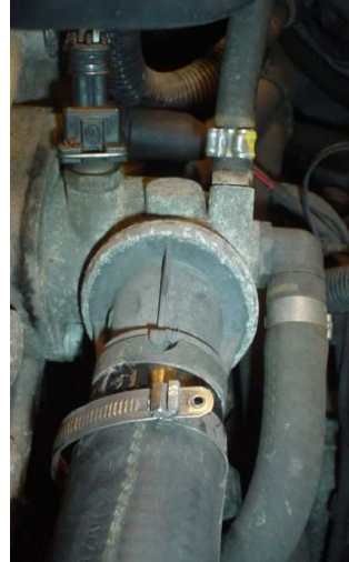
Thermostaat met 2 bouten losdraaien