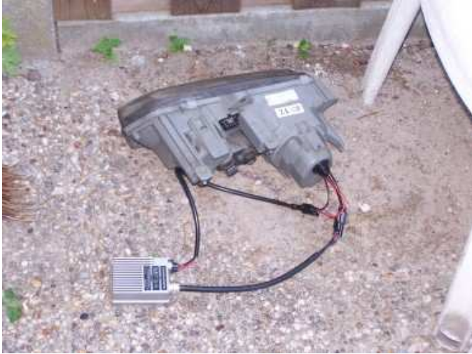
eind resultaat lamp unit