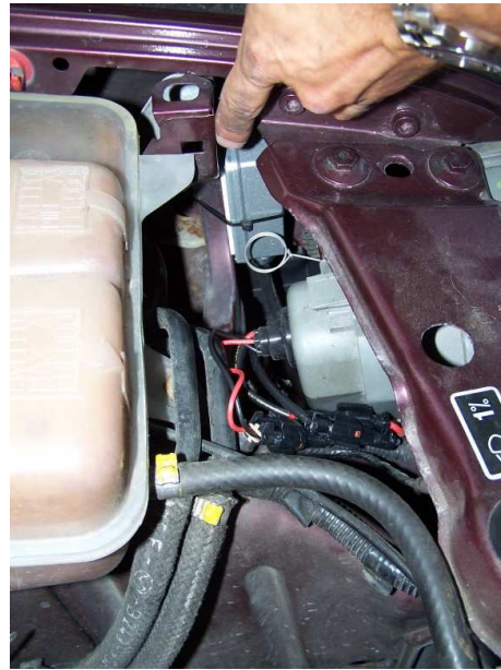
hier zit de krachtbron