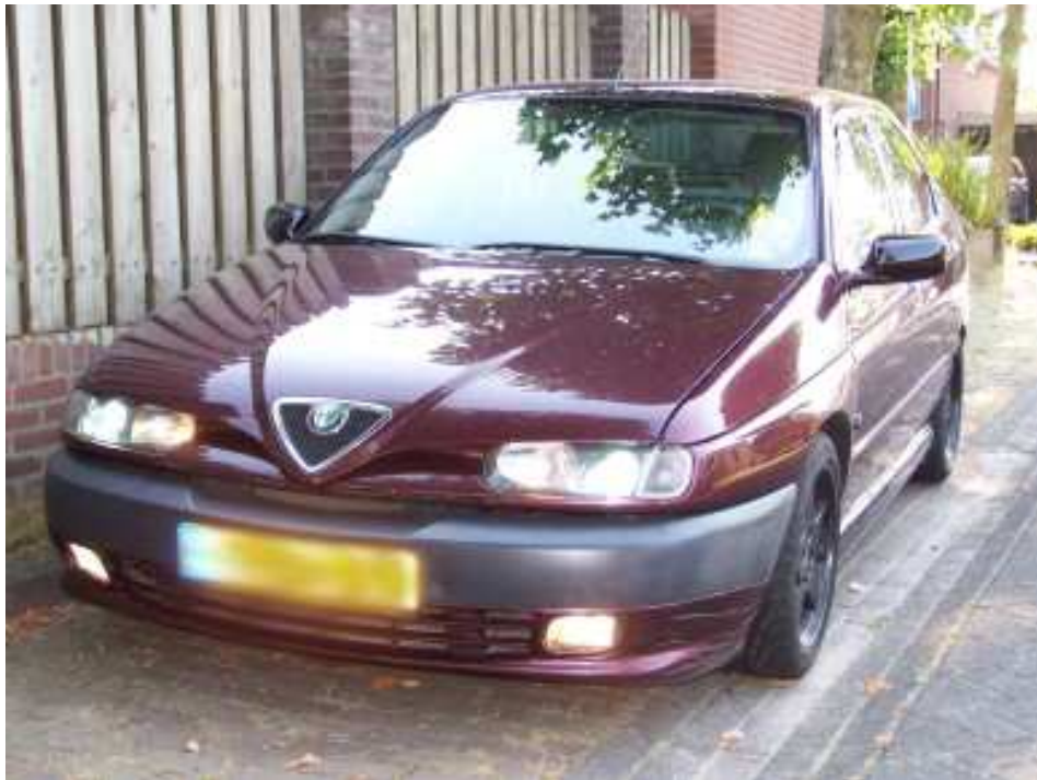
eind resultaat op de 146